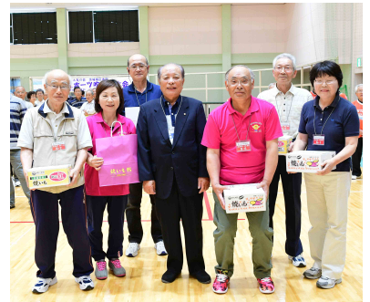
団体優勝：大みか支部の皆さん

年々参加者も増える中、実行委員の皆さんをはじめ多くの方にご協力いただき、無事に開催することができました。運営にご協力いただいた皆さまへ心より感謝申し上げます。