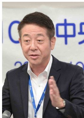
川野営業統括部長