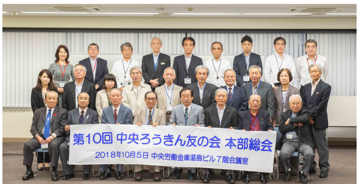
総会に出席された皆さん