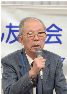
井上会計監査委員

神奈川では1年に最低1回は更新しようと思統一新ししており、9支部が複数回更新している。活動報告等の更新回数が増えれば見たいと思う人も増える。しかし、メールを支店担当者に送信した時にブロックされ送信できないことがあるので改善を