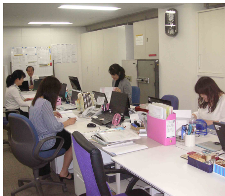
勤労者サービスセンター事務所

その他、損保代理店業務(火災・自動車・ゴルフ・傷害保険)、生保代理店業務(がん・医療保険)、さらにはカタログギフト・クオカード等の販売業務も行っております。