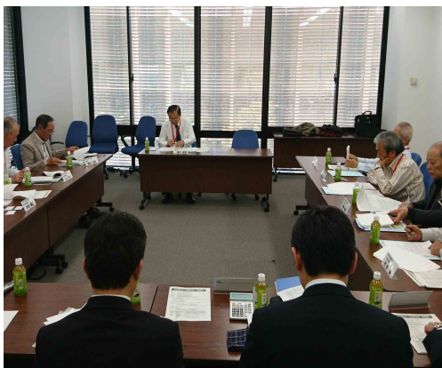
本部役員会議会場