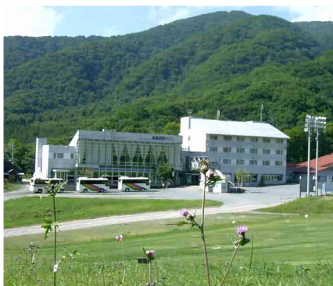
尾瀬高原ホテル全景

是非、お気軽にご利用ください。なお、利用に際しましては、中央ろうきん友の会会員である旨を告げてください。