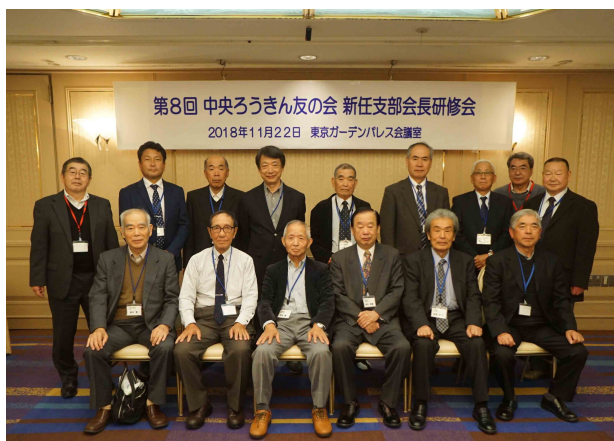
研修会参加者の皆さん

ご協力いただきました関係者の皆様に心より感謝申し上げます 2019年も取組みを行いますのでご協力をお願いいたします