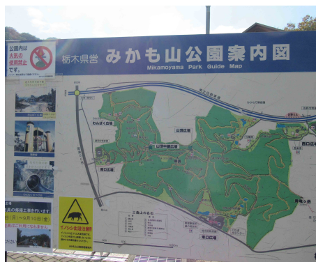
ハイキングコースの県営公園