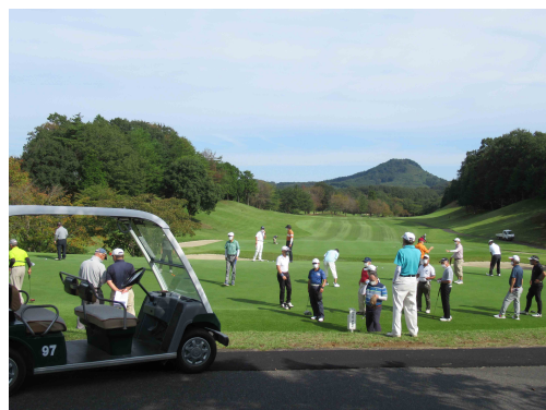
春と秋に開催するゴルフ大会