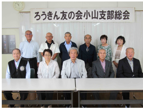
2021年9月の役員総会 役員