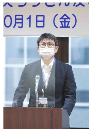
曾我営業統括部次長