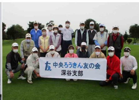
第41回ゴルフ交流会