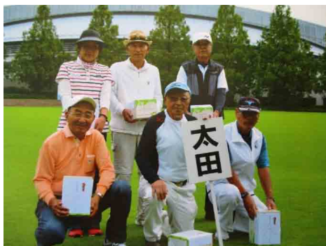
CGG 県大会 団体3位入賞