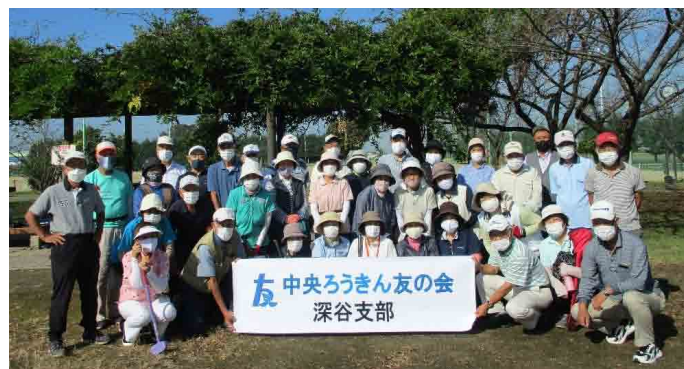
2021年度第1回グラントゴルフ大会

ゴルフ交流会は近隣で安価なゴルフ場で年3〜4回を開催。パソコンクラブは上柴公民館で月2回勉強会を開催。ウォーキングは2016年から年2回開催しています。