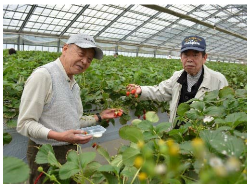
いちご狩りの風景

コロナ禍で、この2年間、主たる行事の開催が出来ませんが、身近での「いちご狩り」や「ミカン狩り」等を開催してきました。支部には、はがき絵による「絵手紙教室」、「和紙ちぎり絵教室」、