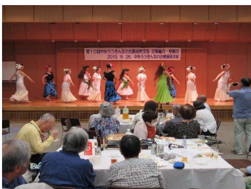
定期総会でのフラダンス