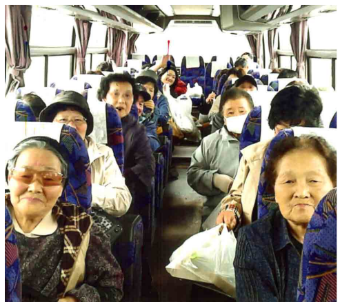
（戸倉中学仮設住宅のお花見風景とお花見会場に向かうバスの車中）