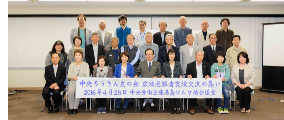
「支援の集い」に参加した皆さんとの集合写真