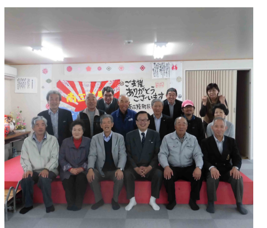
南方第一期・二期の皆さんと

「友の会本部事務局よりご案内」 「支部会報コンクール」に応募いただく作品（1支部1作品）につきましては、2016年7月29日（金）までに「友の会本部事務局」宛にお送りいただきますようお願いいたします。