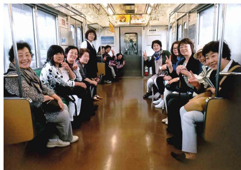
松島に向かう列車の中にて

友の会の皆様といつの日かお逢いするのを楽しみに励んで頑張ります。皆様もお体を大切に。ご自愛下さい。とのお手紙と写真をいただきました。