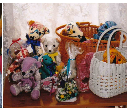
会員の皆さんが作ったティディベア