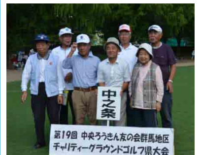
団体3位：中之条支部の皆さん