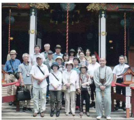
避難者孤立化防止の会交流会

案内いただくなど、天候にも恵まれ有意義な一日を過ごすことができました。中央ろうきん友の会様には大変お世話になりました。とのお手紙と写真をいただきました。