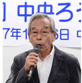
野中役員選考委員長