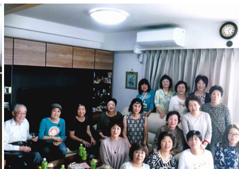
仙台に転居した会員さんの自宅にて