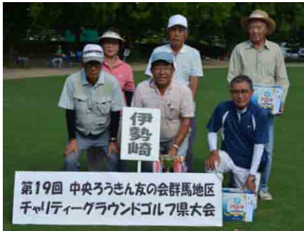
団体優勝：伊勢崎支部の皆さん