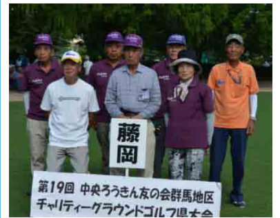
団体準優勝：藤岡支部の皆さん