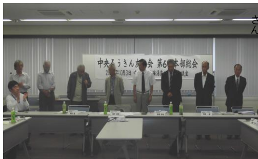
2014年度本部役員の皆様