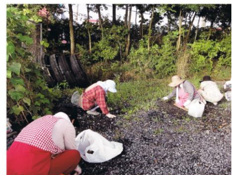
仮設住宅清掃後に飲み物を提供しました。 (南方第2期仮設住宅自治会)

本ニュースに関するお問い合わせについては、右記にある中央ろうきん友の会事務局までお問い合わせください。なお、このニュースは、会員向けのニュースとなっておりますので、地区本部や支部の会議やイベント時にご活用ください。