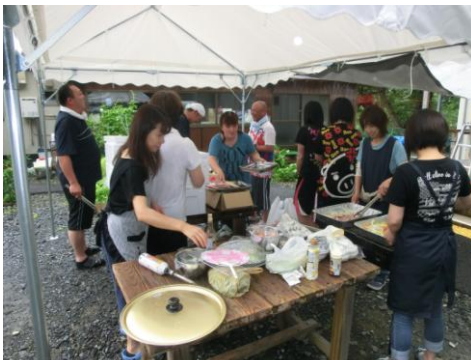
バーベキュー大会で盛り上がりました。 (横山幼稚園跡地仮設住宅自治会)