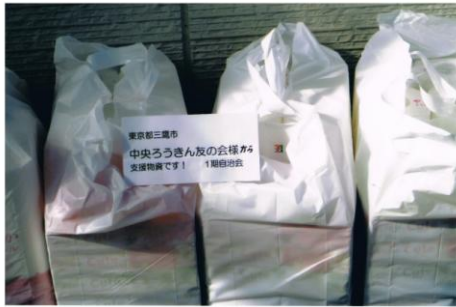
イベントに参加できない方へ日用品をプレゼント (南方第一期仮設住宅自治会)