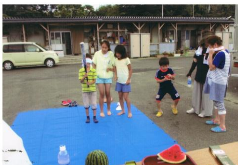
子供もお年寄りも一緒に楽しいひと時を過ごしました。(戸倉中学グラウンド仮設住宅自治会)